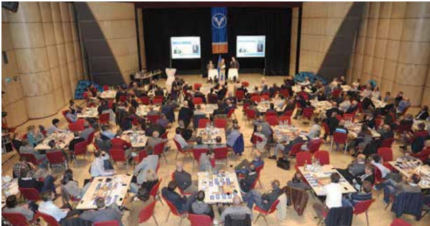
Eine Großveranstaltung bereitet die Führungskräfte auf die Fusion vor

sollten transparent und zeitnah über die Fakten informiert werden. Gleichzeitig wollte die Geschäftsleitung proaktiv auf Bedenken und Emotionen der Mitarbeiter eingehen und die Führungskräfte an der Basis gewinnen. Sie sollten die Fusion mittragen und mit ihren Teams die Integration der 400 neuen Mitarbeiter unterstützen.