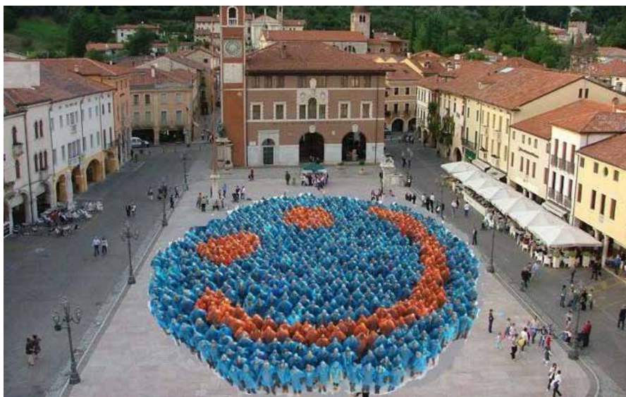
Ein Beitrag einer Arbeitsgruppe: Die Fotomontage zeigt ein Bild aller Volksbank-Mitarbeiter auf dem Hauptplatz von Marostica, dem Sitz der Banca Popolare di Marostica.

Die Erweiterung um 61 Filialen mit knapp 400 italienischsprachigen Mitarbeitern bereitete den Angestellten im deutschsprachigen