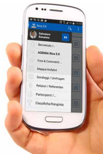
Die Startseite der App: Interaktiver Zugang für Mitarbeiter zu allen Informationen und Diskussionen auf dem Handy

Innovativ war ebenso der Ansatz, die Großveranstaltung mit mehr als 200 Teilnehmern komplett „papierlos“ zu planen: Die Führungskräfte arbeiteten in Tischgruppen zu jeweils sechs bis acht Personen und erhielten während des Tages alle Gruppenaufgaben über die App. Die Diskussionsergebnisse, Beiträge und Fragen der Gruppen wurden nicht auf Karten oder Flipcharts festgehalten, sondern mithilfe von Tablet oder Handy dokumentiert und hochgeladen. So waren die Stellungnahmen der einzelnen Gruppen sofort für alle sichtbar und konnten kommentiert werden. Die Ergebnisse spontaner Meinungsumfragen wurden regelmäßig über Beamer an die Wand projiziert und das Management nahm dazu Stellung. Dadurch entstand ein sehr dynamischer und offener Austausch – ganz ökologisch ohne Papier. Während das Unternehmen früher üblicherweise Veranstaltungsmappen mit allen Informationen und Gruppenaufträgen gedruckt hatte, sparte es sich diesmal tausende Seiten Kopien und hatte sofort eine Dokumentation in Echtzeit. Diese Innovation fand auch unter den Teilnehmern große Zustimmung. Sogar anfängliche Skeptiker der App schätzten die Flexibilität, die laufende Aktualisierung und die Interaktion mit den Kollegen. Auch nach der Fusionsvorbereitung wurde der virtuelle Dialog im Unternehmen intensiv fortgesetzt und zum festen Bestandteil der internen Kommunikation zwischen der Geschäftsleitung und den Mitarbeitern.