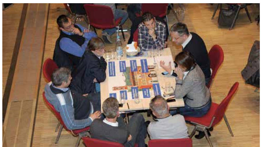
Ein Dokumentarfilm, ein Quiz und ein Puzzle sorgten bei der Veranstaltung für Auflockerung und neues Wissen über die Geschichte und Marktregion der Banca Popolare di Marostica.

Aus den aufbereiteten Workshop-Ergebnissen ließen sich die häufigsten Bedenken der Mitarbeiter herausfiltern: Sie befürchteten vor allem den Verlust der deutschen Arbeitsprache, wenn zu den ohnehin schon 60 Prozent italienischsprachigen Mitarbeitern noch weitere 400 dazukommen. Bis dato wurden Schulungen und Sitzungen in der Bank im-