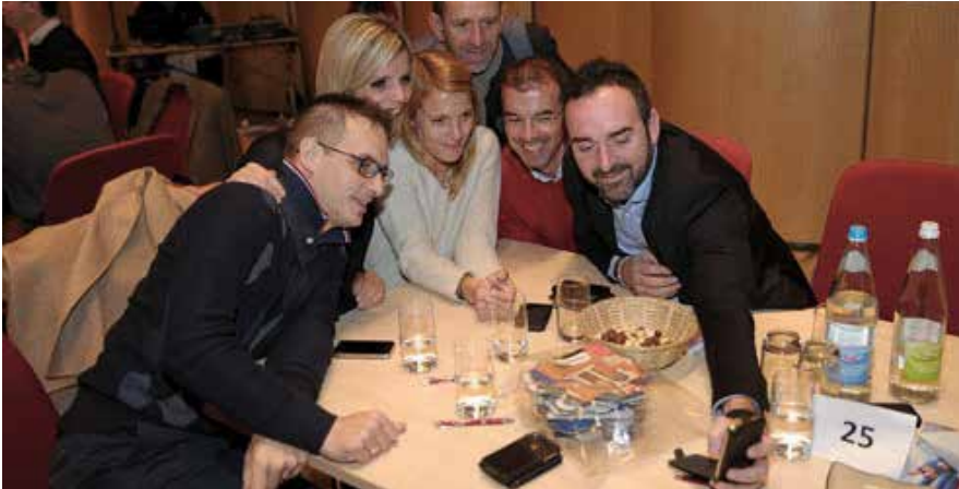
Selfies während der Großveranstaltung statt Punktabfragen